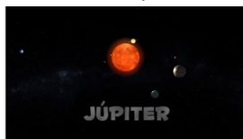
Júpiter, o planeta gigante - O sistema solar em 3D para crianças

https://www.youtube.com/watch?v=i0q-c0ViPww