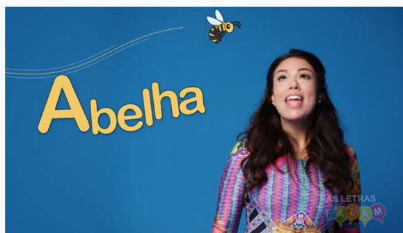
Clipe "As Letras Falam"

ADORO ESSE CLIP! APROVEITO PARA COMPARTILHAR COM VOCÊS ESSA LINDA CANÇÃO NESTA ATIVIDADE DE QUINTA-FEIRA!