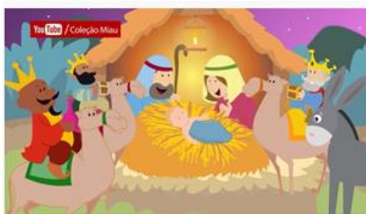
Música de Natal - Noite Feliz, Pobrezinho nasceu em Belém - Coleção Miau